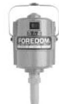
4 Series SR